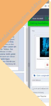
Mediaguides auf der Website

Sie müssen Ihre Ausstellung aktualisieren und somit auch den Inhalt Ihres Mediaguides erneuern - na und? Mit unserem Redaktionssystem additor verwalten Sie alle Inhalte des Guides wie die Seiten einer Website: Mit Text, Bild, Video, Links u.v.m.. Kosten entstehen beim Update nur für die Audioproduktion. Noch besser: Nutzen Sie Teile Ihrer Mediaguide-Inhalte auch für Ihre Website.